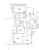
PIANO PRIMO SOTTOTERRA