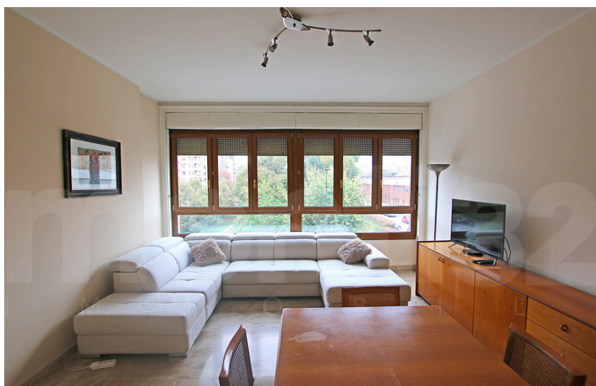
Piazza Po - Dezza.

Nel cuore di una delle zone residenziali più ambite della città, all'interno di un elegante stabile anni '70 con servizio di portineria attivo tutto il giorno e doppio ascensore, proponiamo in vendita una luminosa e ampia abitazione di 132 mq, caratterizzata da una tripla esposizione che garantisce luce naturale in ogni ambiente.