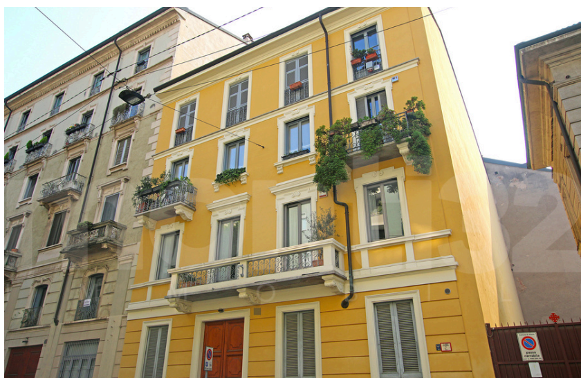
Via Gherardini – Arco della Pace

Un'abitazione unica, che racchiude tutto il fascino dell'architettura milanese d'epoca e il comfort della vita moderna, in una delle zone più esclusive e vivaci della città. A pochi passi dall'Arco della Pace, proponiamo in vendita un'affascinante appartamento di 200 mq disposto su due livelli, situato al terzo e quarto piano di una prestigiosa palazzina d'epoca degli anni '30 con ascensore. L'abitazione, in ottime condizioni interne, luminosissima e con doppia esposizione, conquista per i suoi ampi spazi e il perfetto equilibrio tra stile classico e dettagli contemporanei. Al terzo piano si sviluppa la zona giorno: un elegante salone doppio ideale per ricevere, una cucina abitabile perfettamente attrezzata, una camera/studio, due bagni e due balconi che regalano piacevoli affacci. Una scala interna in ferro, dal design ricercato, conduce al piano superiore, parzialmente mansardato, dove trova spazio la zona notte con tre camere da letto e un bagno. Completano la proprietà una cantina, riscaldamento autonomo, aria condizionata e videocitofono.