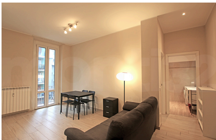
Via Menabrea – MM Maciachini

In un affascinante stabile d'epoca anni '30, servito da portineria mattutina, proponiamo luminoso bilocale di 50 mq in ottime condizioni interne e completamente arredato.