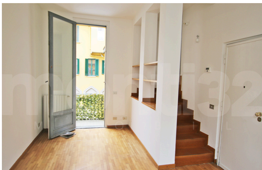
Via Rasori – MM Pagano

In un deliziosa palazzina d'epoca indipendente cielo - terra, dotata di servizio di portineria mattutino, proponiamo luminosa abitazione di 80 mq distribuiti su tre livelli, in doppia esposizione, e collegati da una scala interna. L'ingresso conduce alla zona giorno con cucina a vista e accesso al balcone con zona lavanderia/ripostiglio esterna. Al secondo livello, camera da letto con piccola zona studio e un bagno. Al terzo livello soppalcato, studio/cameretta/guardaroba. L'immobile, in buone condizioni interne, è dotato di riscaldamento centralizzato, porta blindata e pavimentazioni in parquet e ceramica. La posizione è strategica: parchi, scuole, mezzi pubblici, a pochi passi dalla metropolitana e dai negozi di Corso Vercelli. Prezzo € 770.000,00 Classe energetica: F - 177,60 kWh/m²a