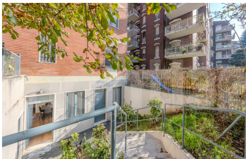
Via Arzaga - Via Giovanni Alfonso Borrelli

In un quartiere prevalentemente residenziale, caratterizzato da eleganti palazzi signorili e dalla vicinanza al Naviglio Grande e a Porta Genova, proponiamo luminoso bilocale di 47 mq completamente ristrutturato, situato in un contesto anni '60 con servizio di portineria mezza giornata. L'immobile, con tranquilla doppia esposizione interna e ingresso indipendente direttamente dallo spazio verde ad uso esclusivo, è composto da: ingresso, soggiorno con cucina a vista, camera da letto matrimoniale e bagno. Dotazioni: riscaldamento centralizzato con radiatori, aria condizionata, porta blindata, pavimentazione in parquet. Prezzo € 260.000. Possibilità acquisto arredamento. Classe energetica C - 71,29 kWh/m 2 anno