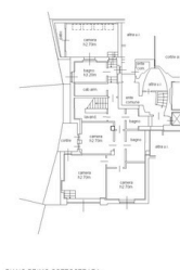
PIANO PRIMO SOTTOTERRA