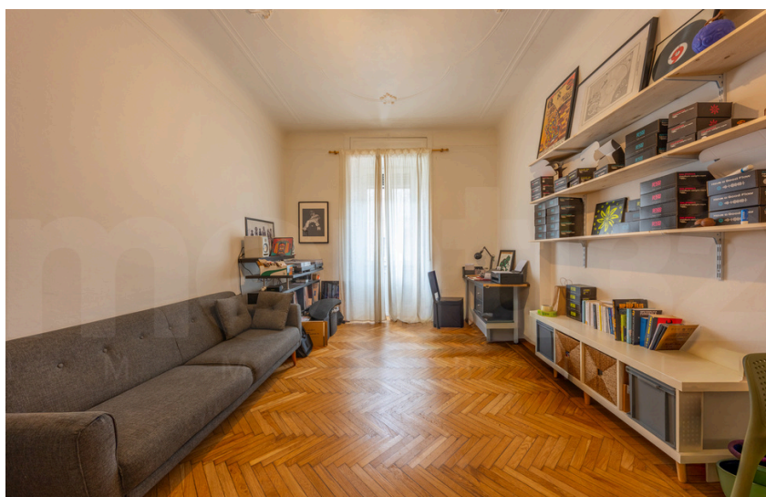
VVia Antonio Stradivari – Buenos Aires.

Nel vivace e multiculturale quartiere di Corso Buenos Aires, una delle principali vie dello shopping Milanese con numerosi negozi, marchi internazionali, ristoranti e locali, proponiamo in vendita luminosa abitazione di 90 mq situata all'interno di un prestigioso stabile d'epoca degli anni '20. L'edificio, dotato di servizio di portineria e ascensore, presenta parti comuni recentemente rinnovate. L'appartamento, caratterizzato da doppia esposizione, è composto da: ingresso, soggiorno con cucina a vista, due camere da letto, bagno finestrato, balcone. Completano la proprietà cantina e solaio. L'immobile si presenta in buone condizioni interne, con possibilità di personalizzazione, e conserva soffitti alti e finiture d'epoca che ne valorizzano il fascino. Dotazioni: riscaldamento centralizzato, porta blindata e posto bici nello stabile. Prezzo € 540.000 Classe energetica F – 175 kWh/m 2 anno