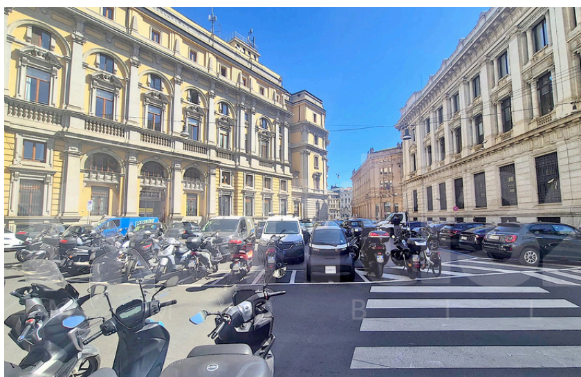
Via del Bollo – Cordusio.

Nel cuore di Cordusio, in Via del Bollo, proponiamo in locazione un prestigioso e luminoso loft di 242 mq, accatastato A/2, inserito in un contesto d'epoca del Seicento.