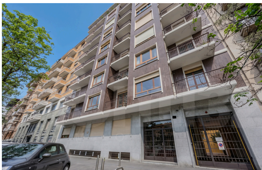
Via Elba – Piazza Piemonte

Situato in uno degli ambiti residenziali più ricercati tra Piazza Piemonte e Via Washington, all'interno di un signorile stabile di fine anni '60 dotato due ascensori e servizio di portineria mezza giornata, proponiamo in vendita un luminoso appartamento di circa 110 mq, caratterizzato da una piacevole doppia esposizione. L'immobile si compone di doppi ingressi, ampia zona living con cucina a vista, due camere da letto, bagno finestrato e due balconi. Completa la proprietà una cantina. La residenza, da ristrutturare, rappresenta un'interessante opportunità di valorizzazione grazie alla razionale distribuzione degli spazi e alla luminosità degli ambienti. Pavimentazioni in parquet e marmo, riscaldamento centralizzato e porta blindata.