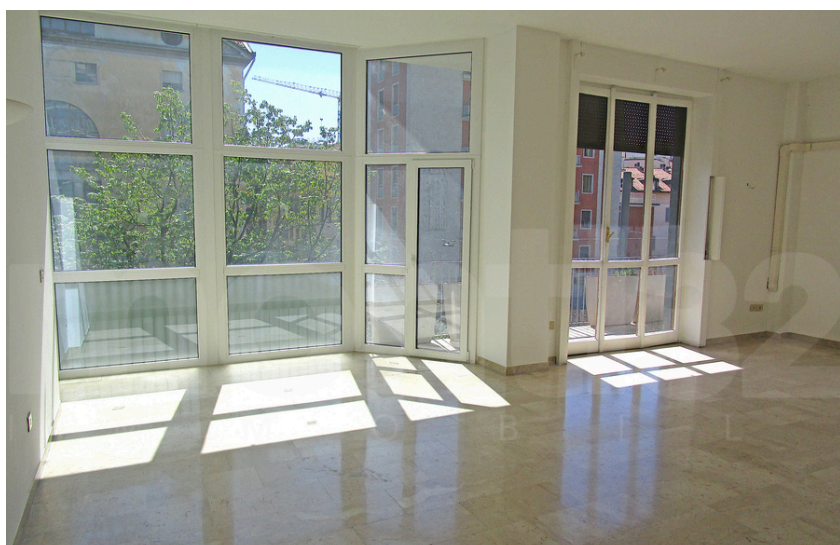
Giardini Calderini – Via Sant'Agnese MM Cadorna

In contesto signorile degli anni '50 dotato di servizio di portineria e ascensore, proponiamo in locazione un luminoso bilocale di 80 mq, caratterizzato da una piacevole doppia esposizione esterna. L'appartamento è composto da ingresso, ampio soggiorno con balcone, cucinotto, spaziosa camera da letto, bagno finestrato e pratico ripostiglio. Completa la proprietà una cantina. L'immobile si presenta in buone condizioni interne ed è parzialmente arredato con cucina, camera da letto e lavatrice in bagno. Dispone di riscaldamento centralizzato, aria condizionata, porta blindata e pavimentazione in marmo. Canone mensile € 1.950,00 oltre spese condominiali. Classe energetica E -158,08 kWh/m 2 anno.